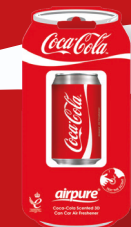
COCA-COLA® Lata 3D